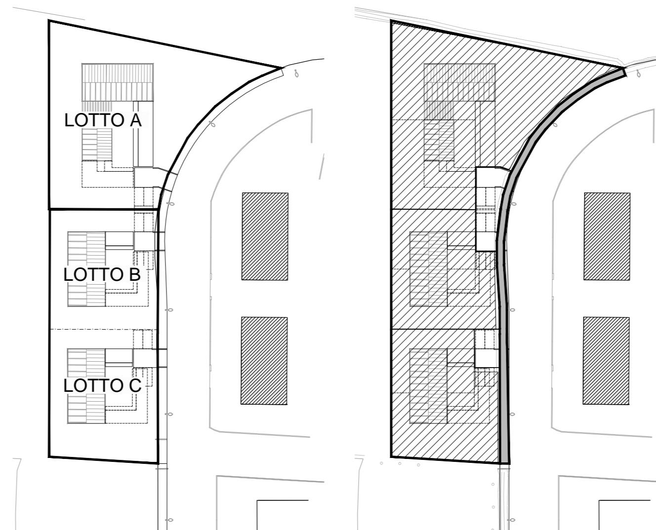
Lotti Regime delle Aree - Aree pubbliche - Aree private - Aree private di uso esclusivo (interne alla recinzione)